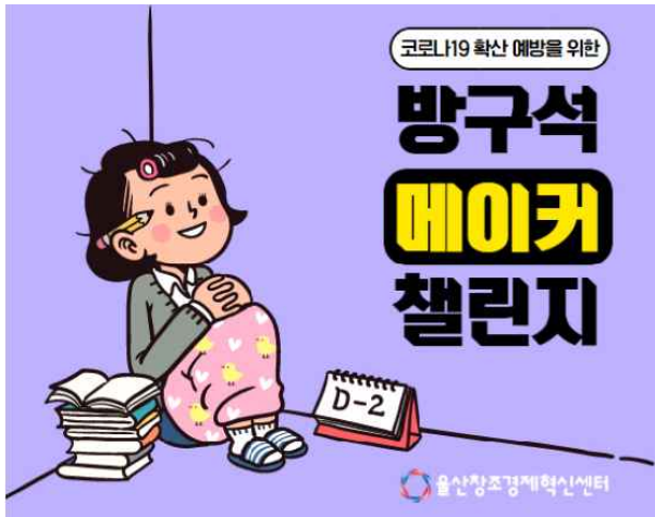
(1) X-mas 트리를 주제로한 방구석 챌린지 시작